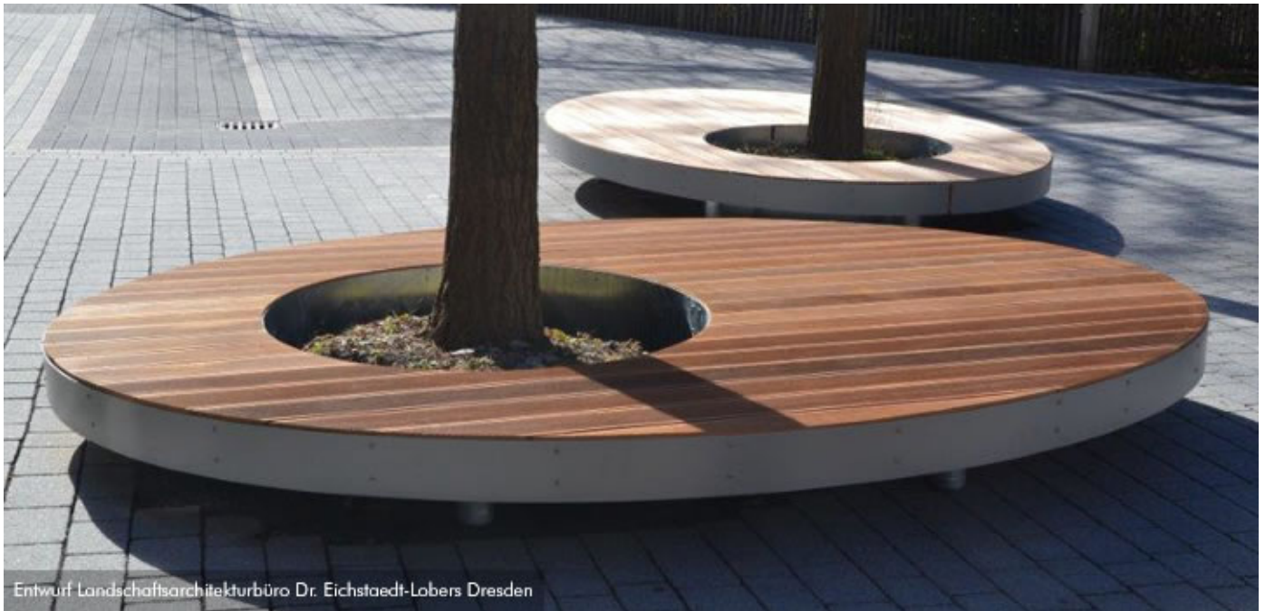
Entwurf Landschaftsarchitekturbüro Dr. Eichstaedt-Lobers Dresden